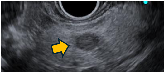
超音波内視鏡で描出された膵神経内分泌腫瘍

超音波内視鏡ガイド下エタノール注入療法は、超音波内視鏡を使って、腫瘍を確認しながら針で腫瘍を穿刺し、エタノールを注入することで腫瘍細胞を壊死させる治療法です。